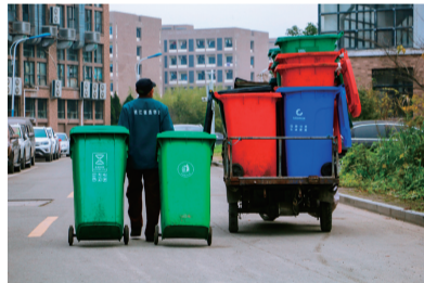
沙沙的转轮声响过校园的不同角落,带走了垃圾,留下一片宽阔洁净。