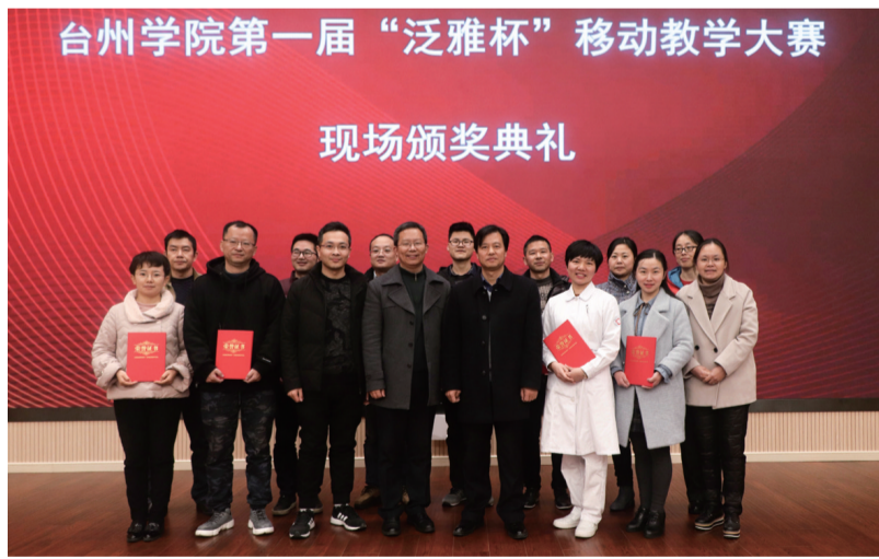
12月13日下午,我校第一届“泛雅杯”移动教学大赛现场模课环节在椒江校区国际会议厅举行。本次移动教学大赛采取线上与线下相结合的模式进行,是学校课堂教学评比模式的一次创新,更是课堂革命的一次大宣传。