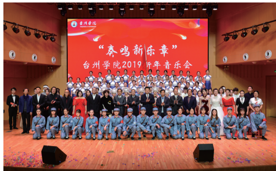
本报讯(学生记者 周钰莎 王晶玲)琴瑟奏佳音,妙曲迎新年。12月28日晚,台州学

院2019新年音乐会在艺术学院音乐厅准时奏响,我校师生欢聚一堂,在美好的旋律中辞旧迎新。台州市有关领导,学校党政领导班子成员,各职能部门、二级学院领导,校第三次党代会代表以及师生代表观看了演出。