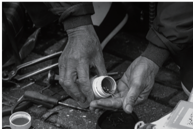
一辆简单的车,一间露天的店铺,却认真打磨一针一线,撑起校园里无数的晴天与脚步。