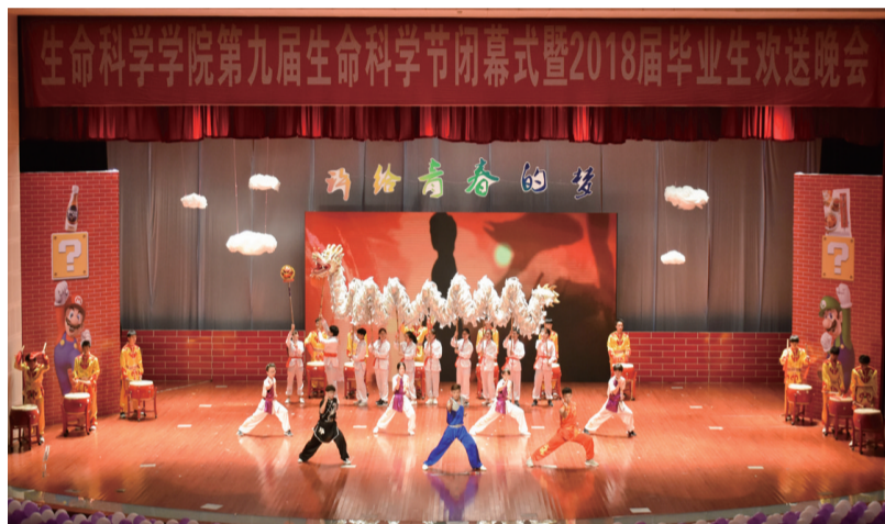
6月18日晚，第九届生命科学节闭幕式暨2018届毕业生欢送晚会在椒江校区大礼堂举行。图为晚会表演精彩的瞬间。