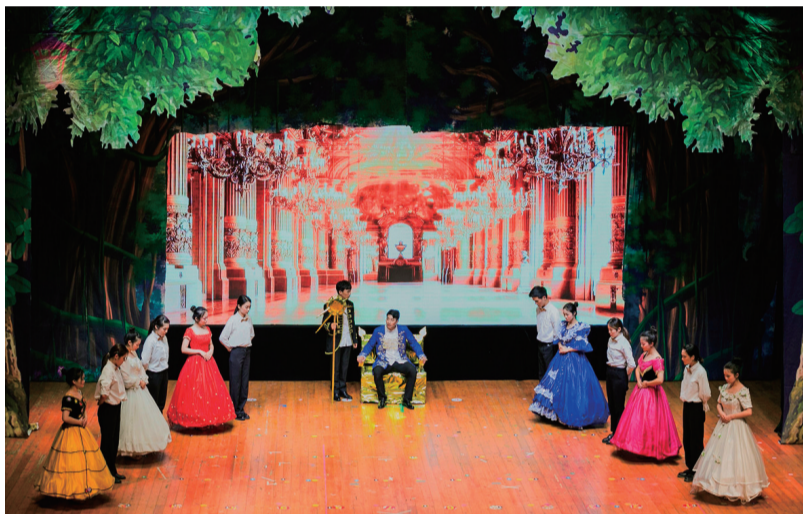
6月3日晚,教师教育学院在临海校区影剧院演出儿童剧《美女与野兽》,图为儿童剧剧照。