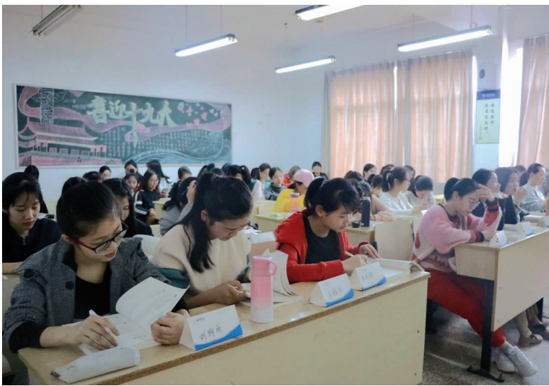
新学期伊始，校党委出台《关于进一步加强和改进机关作风建设的实施方案》文件，要求师生在公共场所上课、自习、参加座谈和会议时，需携带并展示席卡，全校师生积极响应。图为学生带席卡上课。